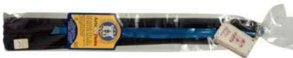
Spagueti con tinta de sepiá, producto seco en bolas de 500 gramos