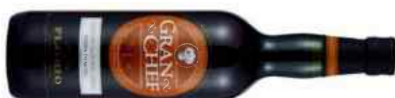
Gran cheff marsala, ideal para cocinar...